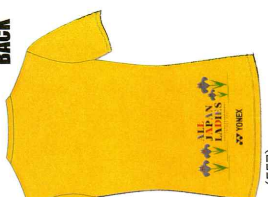
フラッシュイエロー (557)